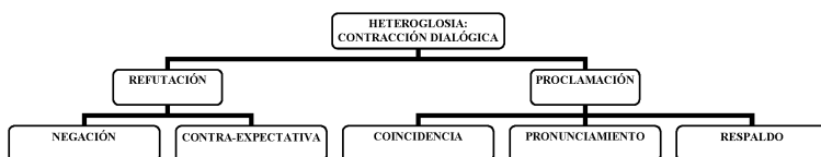
Figura 2.2. El compromiso heteroglósico: contracción dialógica

La Figura 2.2. recoge a modo de resumen los recursos de contracción dialógica.