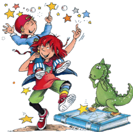
Imagen 2 2