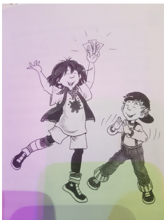
Imagen 4 4

Parece evidente que la orientación católica de la editorial Bruño, que compró los derechos de autor de toda la colección de , ha condicionado la traducción al español de la saga alemana. Como afirma Juan Marco Vaggione (2008:14), entre los promotores de un sistema hegemónico machista y defensor de una concepción única de familia destaca la jerarquía de la Iglesia católica y sus sectores aliados. Según Vaggione, para la Iglesia, defender la familia es una forma de defender la cultura, amenazada por las demandas de los movimientos feministas y por la diversidad sexual, pues no olvidemos que en la , preparado por la Congregación para la Doctrina de la Fe en el año 2004, se responsabiliza al «feminismo radical de los últimos años porque induce a la mujer a creer que para ser ella misma tiene que convertirse en antagonista del hombre, llegando a una rivalidad extrema entre sexos, en que la identidad y el rol de uno son asumidos en desventaja del otro».