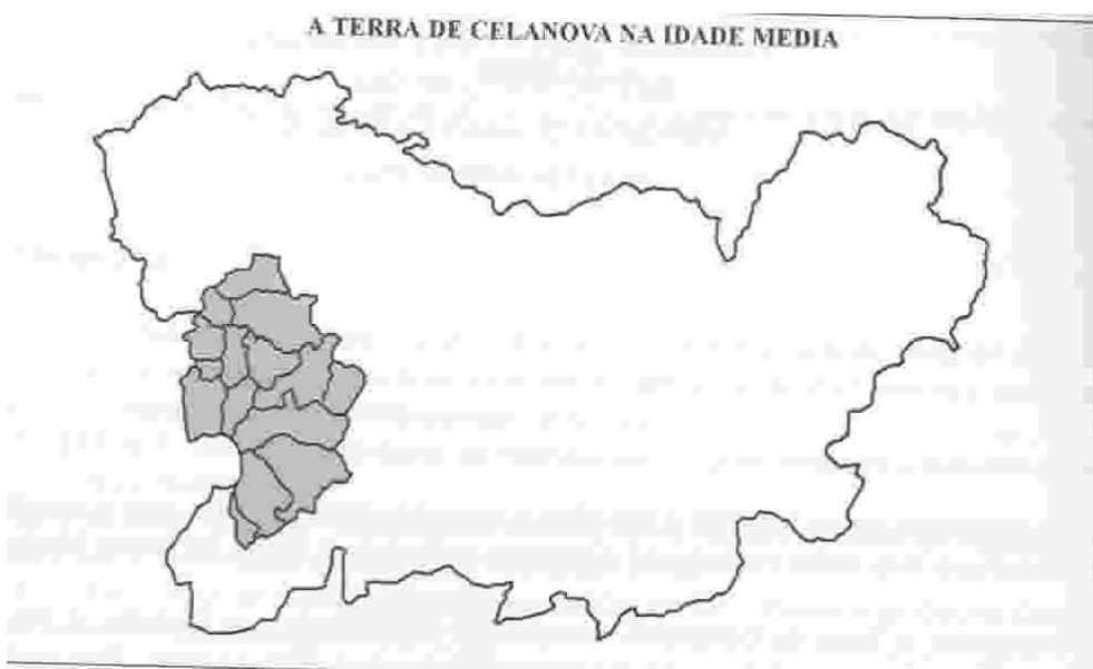
A TERRA DE CELANOVA NA IDADE MEDIA

O que pretendemos estudar é a conformación do espazo xurisdiccional neste territorio, tendo en conta: 1) que o mosteiro de Celanova exerceu a súa xurisdicción noutros lugares, como Cualedro ou Verín; e 2) que neste espazo exercen xurisdicción, como se verá, non só Celanova senón tamén outros señores, como el rei ou o mosteiro de Ramirás.