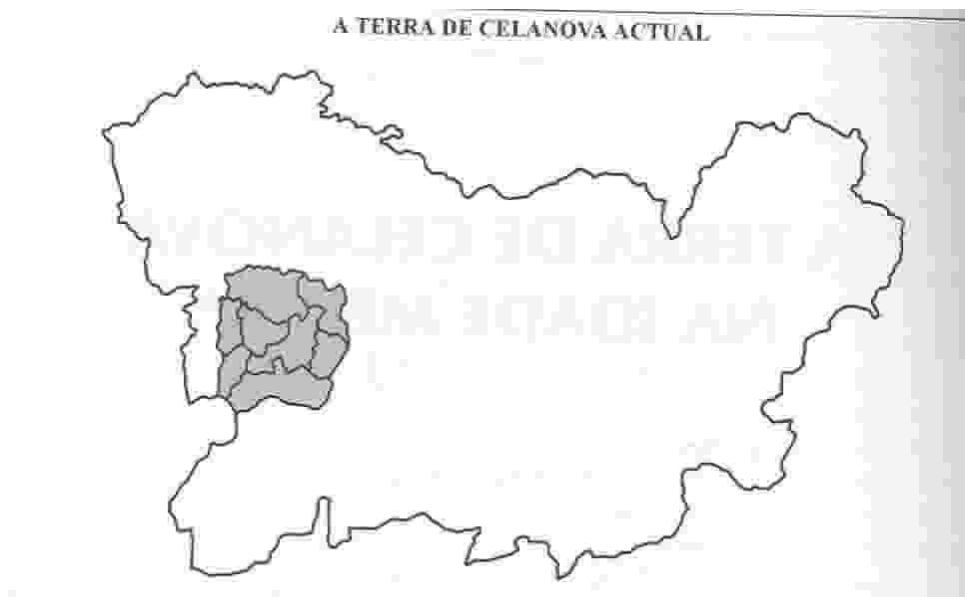
A TERRA DE CELANOVA ACTUAL

Polo tanto, neste traballo, referirémonos aos concellos que conforman hoxe a actual comarca da Terra de Celanova, con excepción da Merca, máis os de Arnoia, Cortegada, Padrenda, Bande, Lobeira e parte dos de Castrelo de Miño e Lobios.