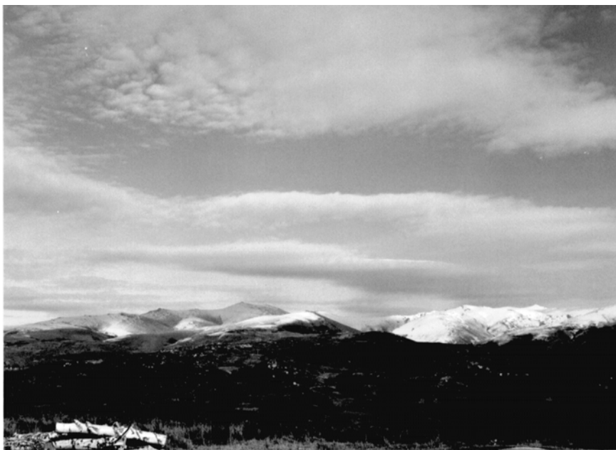
Fig. 2. Panorámica de las cumbres de Trevinca desde los Llanos de Lamalonga