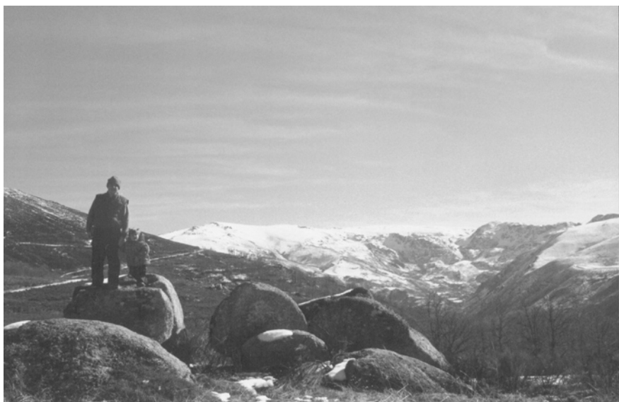
Fig. 3. Vista del valle alto del Río Xares desde la superficie de O Carboeiro