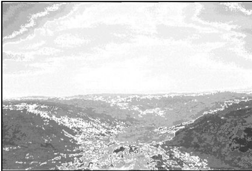
Fig. 6. Panorámica desde la cumbre de Pena Trevinca hacia el SE (Zamora)

encuesta de ensayo que hemos elaborado recientemente con 70 estudiantes de varios niveles (bachillerato/universidad/doctorado) en la ciudad de Ourense, la mayoría de las respuestas (56%) revelaban tan solo un uso delegado o vicario (conocimiento mediante folletos, guías, audiovisuales locales) de este espacio natural. Pero, además, las Tierras de Trevinca guardan numerosos motivos de interés como Patrimonio Cultural entre sus pequeños asentamientos de montaña: restos de castros, molinos, fuentes, arquitectura popular, antiguas explotaciones, mitos y leyendas; entre éstas últimas se cuenta especialmente como tradición de las altas tierras la de “A Lagoa da Serpe”.