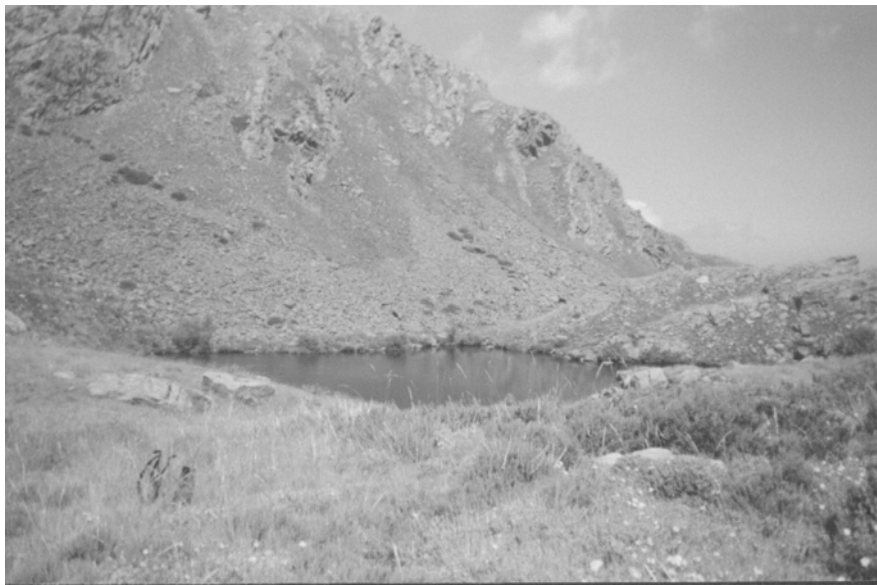
Fig. 4. Modelado Glaciar: Lagoa da Serpe