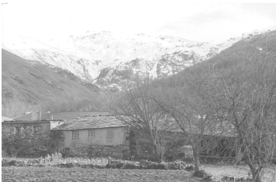
Fig. 5. Secuencia vertical del Paisaje desde el fondo del valle del Xares