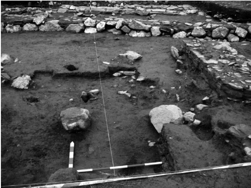
Fig. 3.- Área das unidades 12-D/2 e 12-E/3, cos coios e furados de poste.

No subsector 12-D/2 as estruturas non parecen ter ningunha distribución definida, e a súa función poido ser moi diversa, tanto de construcións feitas de materiais perecedoiros como de elementos menores (bancos, postes de uso indeterminado. etc.). A cota final de nivelación está marcada por unha capa (a 6) de terra parda-amarela na que se documentan varios furados para poste de forma e tamaño diferentes (pero sempre arredor dos 20-25 cm. de anchura e uns 25/30 cm. de fondura), algúns deles con laxas fincadas nos bordes. Nunha cota análoga e ó igual que na unidade 12-D, aparecen máis coios de seixo branco, e na zona central veuse unha acumulación de argamasa asociada a furados de poste, bloques de cuarzo e unha mancha con restos de pallabarro ( fig. 3 ).