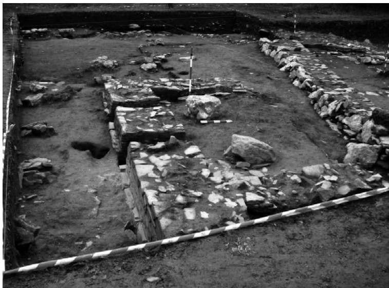
Fig. 2.- Área do Antecastro coas dúas estruturas pétreas.

boas dimensións ( fig. 2 ), formando unha especie de rebanco irregular, tamén consonte co que sucede no resto do poboado, onde hai unha clara preferencia por este material cuarcítico á hora de chantar os alicerces dos muros.