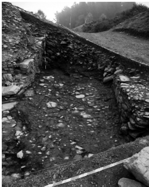
Fig. 6.- Camión empedrado de saída da croa entre os dous batentes da muralla.

Entre o inxente derrubamento pétreo e entre as pedras de maior tamaño, recuperáronse anacos de tégulas e ímbrices, polo que é posible pensar na existencia dalgunha pequena construción (¿ou lintel voado?) no remate da muralla ou sobre a propia entrada.