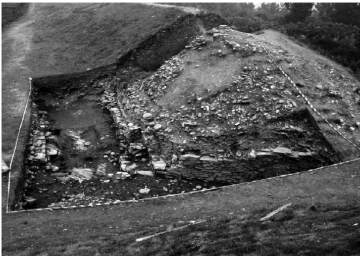
Fig. 5.- Conxunto da área escavada na Entrada, coa esquina da muralla.

En efecto, descubriuse o paramento do bastión ou batente esquerdo da muralla, que define e limita o acceso á croa. Está construído en mampostería irregular con fiadas de