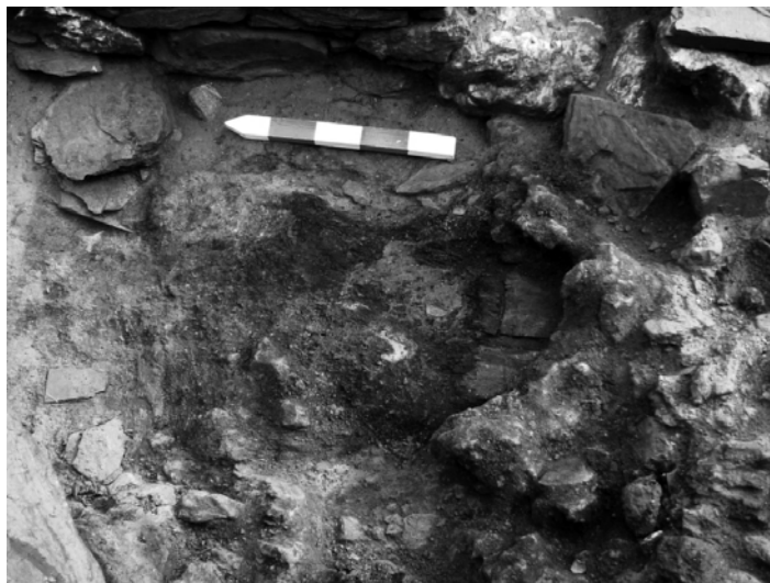
Fig. 4.- Pallabarras e restos de madeiras queimadas na unidade 12-D/3.

Xusto no ángulo NO. da sondaxe documentáronse restos de táboas ou madeiras carbonizadas e deitadas entre o pallabarro ( fig. 4 ). Ó seu lado apareceu tamén o que parece ser un tronco fincado e queimado, asociado todo isto a concentracións de sementes estendidas en todo este lado Oeste do cadro 12-D/3, sementes tamén carbonizadas e que son dalgún cereal como millo miúdo ou trigo á espera das análises oportunas.