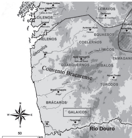
Fig. 2. Posible localización dos “primeiros” Galaicos

Pero esa coreada conquista había ter consecuencias moi limitadas no seguinte período, inzado en Roma de conflitos civís que entorpecían o establecemento dun