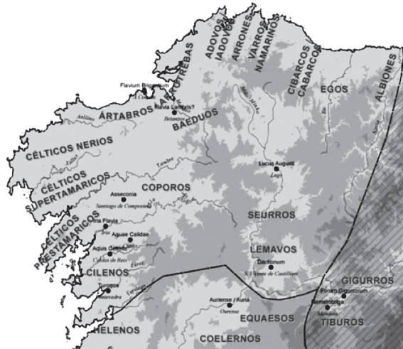
Fig. 3. Celtici e Ártabros (modificado de Brañas et al 2007)

Mais, superada a punta máis setentrional e occidental representada polo cabo Nerio (Promontorio Ártabro?), a costa vira cara a oriente e é ese espazo o que habitan os Ártabros-Arrotrebas, “aínda pobo celta, e logo os Ástures” (segundo Mela III 13). Ártabros-Arrotrebas e Célticos emparentados cos do Anas son Celtas, pero distínguense nas descrições dos antigos porque hai conciencia dunha historia diversa. Dos Célticos do Anas sabemos que os romanos os consideraban celtas procedentes da Meseta, incluso se supón que o étnico Celtici “célticos” é un exoetnónimo de orixe romana para distinguir a estes celtas migrantes. Cando no século II a.C., presionados polo acoso romano, se viron obrigados a desprazarse de novo ata a rexión galaica, parece que eles mesmos tiñan asimilado ese etnónimo, porque así se autodenominan case 200 anos despois na epigrafía galaica. Pero os Ártabros, polo que deixan entrever os textos, eran tamén celtas e xa estaban alí á chegada dos Célticos.