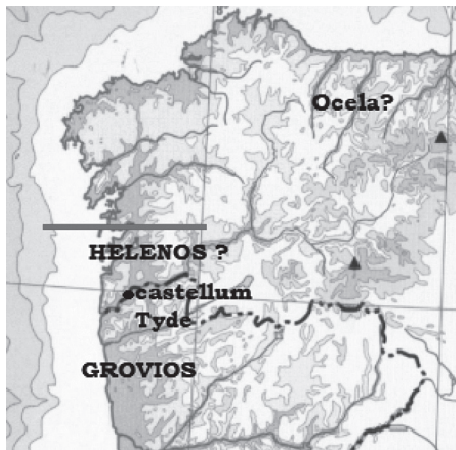
Fig. 6. Os gregos na xeografía galaica

Estes emporios, erixidos ao longo de toda a costa atlántica dende Santa Olaia na foz do Mondego ata A Coruña, recoñécense arqueoloxicamente por algunhas estruturas construtivas anómalas dentro da tradición castrexa (A Lanzada, Castro de Alcobre, Castro de Elviña), como tamén pola abundantísima cantidade de restos de importación (adornos metálicos e de vidro, vasillas finas e de transporte, etc.: illa de Toralla, Castro grande de Neixón, etc.).