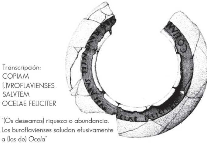
Fig. 5 Grafito Ocela (Villa Valdés 2016)

Ocelas é o nome dun escuro heroe troiano que ben podía atopar homfonías na toponimia de todo o Noroeste, como dixemos, onde o elemento é abundantísimo. A forma toponímica cantábrica máis próxima aos Ártabros que coñecemos, aparece en territorio dos Albións, eles mesmos homónimos dos Albións británicos (“os do norte” en lingua celta), situados en territorio actual asturiano, ao leste do río Navia. Menciona Ptolomeo un Ocelo entre as “cidades” interiores do convento lucense e temos documentada a forma Ocela nun grafito cerámico do Castro de Chao Samartín (Fig.5), castro co que quizais se identificase o topónimo supostamente grego transmitido por Asclepiades. A historia deste castro é suficientemente prolongada (con imponentes restos materiais correspondentes ao Bronce Final) e transcendente (converterase en capital de civitas en época imperial) 23 , como para pensar que se tratase dun lugar “eminente”, como o seu propio topónimo indica!