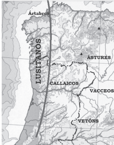
Fig. 1. Mapa segundo Polibio

A desconexión dos Callaicos do resto dos pobos do “occidente lusitano” é unha información pouco clara e sutil, na que se dá a entender que, en época republicana, os Callaicos eran, efectivamente, “outra xente”, merecedora dun nome particular pois habitaban tamén un territorio singular, “elevado e escarpado”.