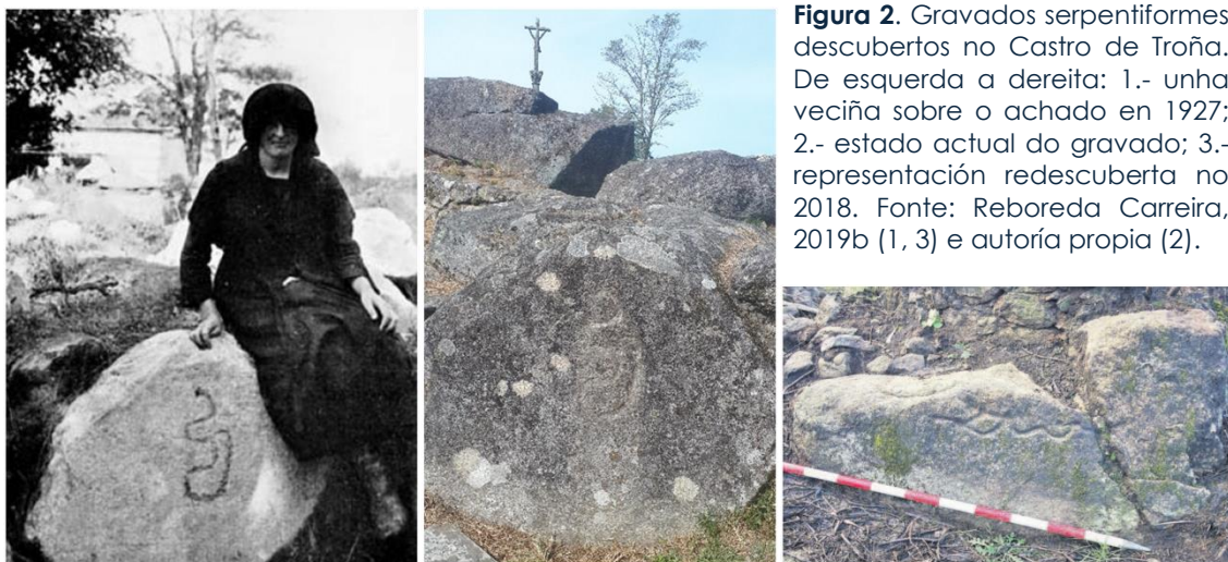
Figura 2. Gravados serpentiformes descubertos no Castro de Troña. De esquerda a dereita: 1.- unha veciña sobre o achado en 1927; 2.- estado actual do gravado; 3.- representación redescuberta no 2018.

Pese a que o conxunto de arte rupestre ao aire libre foi circunscrito nun primeiro momento á Idade do Bronce, estes soportes albergan igualmente motivos históricos como consecuencia do re-aproveitamento e o uso diacrónico das rochas a través dos séculos. Na análise da distribución deste conxunto obsérvase para o Condado unha tendencia a localizar os gravados en altitudes medio-baixas –entre os 0 e 500 metros–, máis cunha concentración salientable de insculturas que se sitúan entre os 350 e 500 metros 10 . A disposición da arte gravada tamén acostuma a ser en espazos chans e con certa facilidade de acceso entre as zonas de val e as de maior altitude, de aí