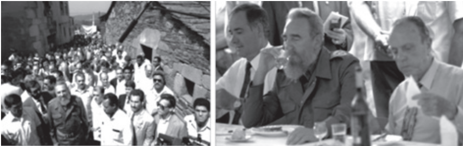
Figura 6: Fotografías de la visita de Fidel Castro Ruz a la casa natal de su padre en San Pedro y de la comida popular celebrada en Armea. 28 de julio de 1992.

Tras la comida llegó la famosa partida de dominó que para algunos concluyó en empate y para otros ganó Fraga. Capón se colocó detrás de Fidel, hecho que enfadó a Fraga. “¡Siéntese ahora mismo y no se levante mientras yo sea presidente!”; espetó el dirigente de la Xunta al entonces alcalde. “Entonces mucho me tengo que quedar sentado”, sentenció el exregidor. Tras la partida, Fidel Castro visitó el paseo del Malecón en el vecino Ayuntamiento de Sarria antes de regresar de manera definitiva a Lugo, donde puso punto y final a un viaje inolvidable que quedará grabado para siempre en la retina de los lancarenes.