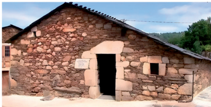
Figura 1: Fotografía actual de la casa natal de Ángel Castro en la parroquia de San Pedro, Láncara.