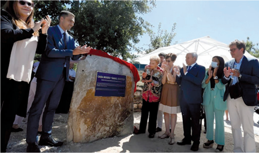
Figura 14: Autoridades y representantes institucionales gallegos y cubanos, en el exterior de la Casa Museo durante el acto de inauguración. 28 de julio de 2022, Láncara.

Finalmente tuvieron lugar los discursos oficiales, entre los que destacó el de Mariela Castro, que quiso tener un recuerdo especial para su abuelo, “un hombre humilde que salió de su tierra amada por una gran necesidad económica, lamentablemente tuvo que salir como carne de cañón, en la última etapa de la guerra de la independencia económica y que ayudó a muchos gallegos”. Para Pablo Rivera, “Ángel Castro, vuelve definitivamente a casa de la mano de un museo, una instalación que será un auténtico símbolo de nuestro pasado, nuestro presente y nuestro futuro” 79 .