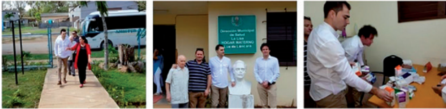
Figura 10: Visita de la delegación al Hogar Materno Luz de Láncara en La Lisa.