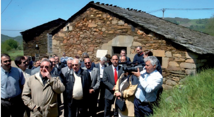
Figura 7: Fotografía de la visita de Raúl Castro a la casa natal de su padre. 5 de mayo de 2005.

Raúl, en cuya visita no subyacía ningún interés político, fue recibido por el exalcalde Eladio Capón López y por Carlos López Sierra. Poder comprobar la humildad de la casa de su padre no solo fortaleció su apego personal con Galicia, sino que también reafirmó la importancia de las raíces gallegas para la esencia cubana, lo que contribuye a explicar mejor la influencia de las conexiones diaspóricas en la conformación de las identidades tanto individuales como colectivas.