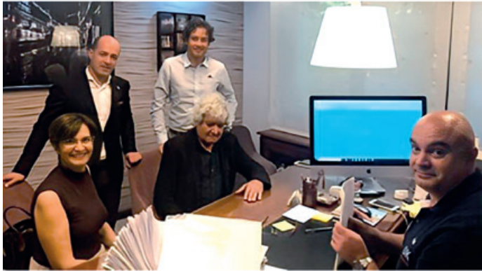
Figura 12: Firma de la cesión de la casa de los Castro en la notaría de Sarria.