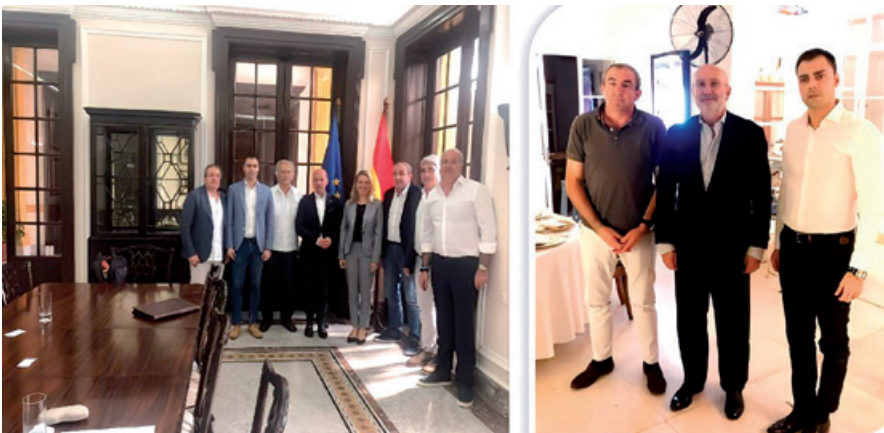
Figura 13: Reunión en la Sede de la Embajada de España en Cuba y encuentro con el embajador de España en el Hotel Le Petit Mistinguett.

Esta misión, al igual que todos los intercambios de esta nueva etapa tenía una doble vertiente. En primer lugar, la empresarial. Por ello, la delegación mantuvo diversas reuniones de trabajo en este ámbito. La primera tuvo lugar el 14 de enero de 2019 en la sede de la Embajada de España con la Ministra Consejera, Dña. Nuria Reigosa González, y con el Consejero Económico y Comercial, D. Federico Ferrer Delso. Se abordaron tres cuestiones. Por un lado se informó del grado de avance del Museo de la Emigración, tema que se comprometieron a poner en conocimiento del Ministerio de Cultura. Por otro, el interés de varias empresas de la provincia en abrir negocio en el país. Y finalmente, se abordó el problema del retraso de los pagos a aquellas empresas ya instaladas en la isla. Todas estas cuestiones serán puestas en conocimiento, días más tarde, de D. Juan Fernández Trigo, Embajador de España en la República de Cuba, que no pudo estar presente en el primer encuentro al encontrarse de visita institucional por el país.