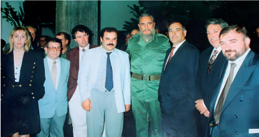
Figura 4: Fotografía da recepción de Fidel Castro en el Palacio de la Revolución (Habana) a integrantes da delegación de Láncara. Marzo de 1992.

Este caso proporciona un valioso ejemplo de cómo las entidades locales pueden participar en la diplomacia internacional, y cómo las conexiones personales y culturales pueden ser utilizadas para forjar lazos diplomáticos. En conclusión, este pionero y humilde grupo de enviados sentó un precedente relevante en la progresiva normalización de las relaciones bilaterales entre ambos territorios y abrió la puerta al estrechamiento de lazos históricos y familiares.