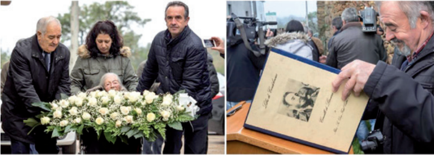
Figura 8: Fotografías de la ofrenda floral y del libro de condolencias durante el homenaje celebrado delante de la casa natal de los Castro.

Esta respuesta pública a la muerte de Fidel se convirtió en un acto simbólico en el que Lán cara expresó una vez más su respeto y complicidad con la familia Castro y, por extensión, con Cuba. Estos gestos contribuyen a construir identidades y a transmitir mensajes que ayudan a comprender mejor la profundidad y la intensidad de las relaciones entre ambos territorios, como el pronunciado por Darío Piñeiro una vez concluido el humilde homenaje: “para nosotros Fidel Castro no ha muerto, es un gallego más. Siempre llevó Lán cara a todos los rincones a los que fue y gracias a él somos conocidos a nivel internacional”, una afirmación que incide en una identidad gallega que trasciende a las fronteras geográficas. Su antecesor, Eladio Capón, aludió en esa sentida ceremonia, a lo “ameno” y “humano” que era Fidel Castro cuando entablaba una conversación y se despidió con un “hasta siempre, comandante” 63 .