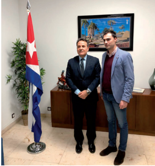
Figura 9: Fotografía de la recepción en la Embajada de Cuba en España (Madrid).

Hasta el momento la parte más sentimental y nostálgica parecía perfectamente cubierta. Sin embargo, no debemos olvidar, que el viaje también se planteó siempre desde un punto de vista empresarial y comercial. Para garantizar ese cometido, en cuarto lugar, el 25 de enero de 2018, el Ayuntamiento de Lánçara y la Confederación de Empresarios de Lugo firman un Protocolo General, que tiene una relevancia significativa tanto para el municipio como para las empresas de la provincia de Lugo. En él, el consistorio se compromete a prestar apoyo institucional y la “marca” del Ayuntamiento de Lánçara, siempre y cuando redunde en un claro beneficio económico y social para las empresas y ciudadanos del municipio. Por su parte la CEL, reconoce al Alcalde de Lánçara o miembro de la corporación municipal en quien delegue la capacidad para actuar como embajador de las iniciativas empresariales de la provincia de Lugo con la República de Cuba, como consecuencia de los vínculos existentes.