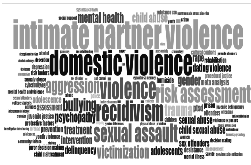
Figura 1. Frecuencia de aparición de las “palabras clave” en los artículos publicados en las revistas analizadas en la Web of Science (2014-2018)

En la Figura 2 se puede observar el análisis de redes (interacción de palabras clave), donde hay tres grandes áreas claramente definidas. La más pequeña se centraría en el estudio de la “evaluación y estudio del riesgo de reincidencias” (color verde). Las otras dos áreas más desarrolladas, estarían muy relacionadas entre sí estudiando factores relacionados con “delitos violentos y agresiones” (color azul) y el “abuso sexual o agresiones domésticas” (color rojo).