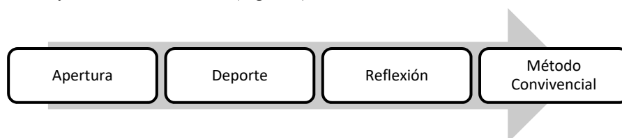
Figura 1. Fases de la metodología convivencial

El método se divide en tres fases conocidas como momentos que están estratégicamente diseñados para enseñar habilidades para la vida a los participantes. La sesión se basa en: i) una apertura para brindar los acuerdos y la cita con los participantes y monitores, estos últimos son responsables de velar por el cumplimiento de los acuerdos durante la sesión; ii) la práctica de currículos deportivos o artísticos junto con el seguimiento de convenios; iii) el final de la sesión con retroalimentación de los monitores, evaluación y una frase motivadora (Figura 1).