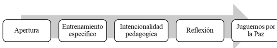
Figura 4. Fases de la Metodología Juguemos por la Paz

La metodología combina cuatro partes (Figura 4) durante las sesiones de entrenamiento: i) la apertura donde el entrenador da la bienvenida a los participantes y explica las actividades de la clase; ii) la realización de ejercicios específicos en el campo, donde practican los participantes sus habilidades deportivas con ejercicios combinados con un contenido específico para el desarrollo de habilidades para la vida; iii) se realizan juegos con intención pedagógica por parte de los participantes donde aplican las habilidades proporcionadas durante la sesión; y, iv) finalmente una sesión de reflexión guiada por el entrenador donde se discute con los participantes sobre cómo pueden traducir este aprendizaje en sus actividades diarias (Click Arte, 2015).